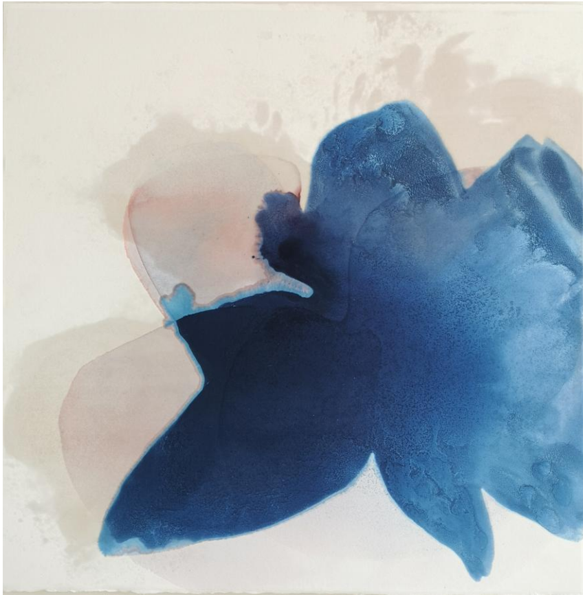
Patricia ERBELDING, Sans titre , 2021, encre et cire sur papier sur support bois, 50 x 50 cm