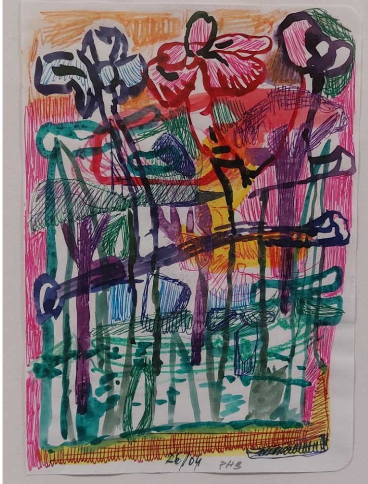
Philippe BORDERIEUX, 26 e jour d'avril , 2020, technique mixte sur papier