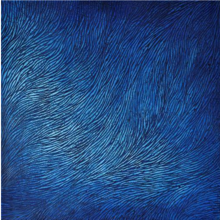
Mylène MAI, Immersion 2 , 2021, plâtre sculpté, pigments et vernis naturel, 100 x 100 cm

Pour en savoir plus : www.mylene-mai.com