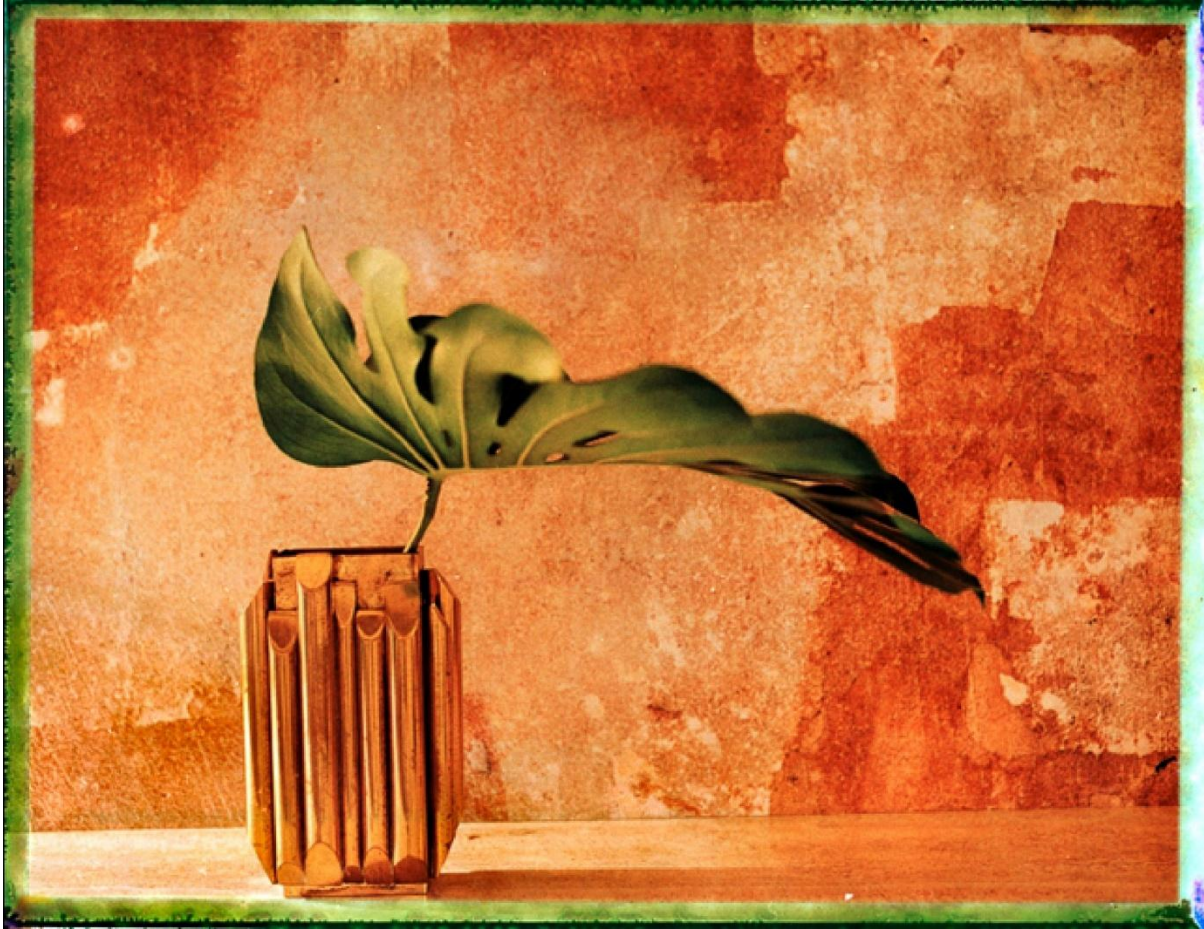
Julien DRACH, Still Life Polaroid 8 , impression numérique sur papier, édition de 8

Pour en savoir plus : juliendrachstudio.com