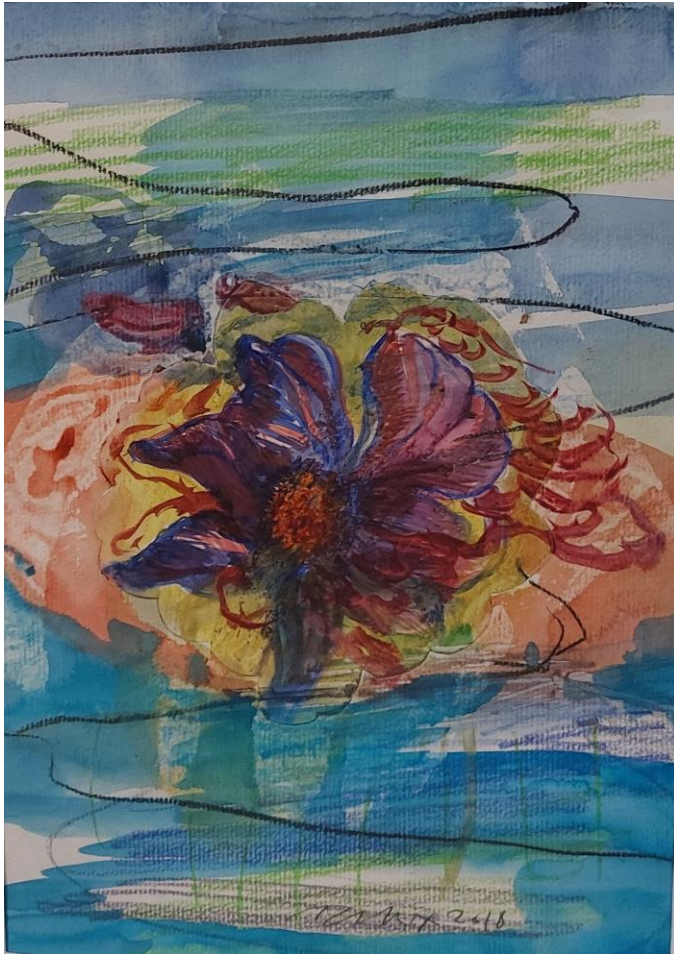
Philippe BORDERIEUX, Hortus , 2020, technique mixte sur papier