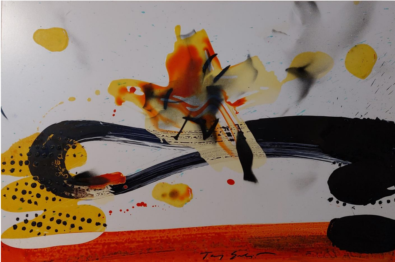
Tony SOULIE, Flowers , 2016, Technique mixte, 60 x 90 cm