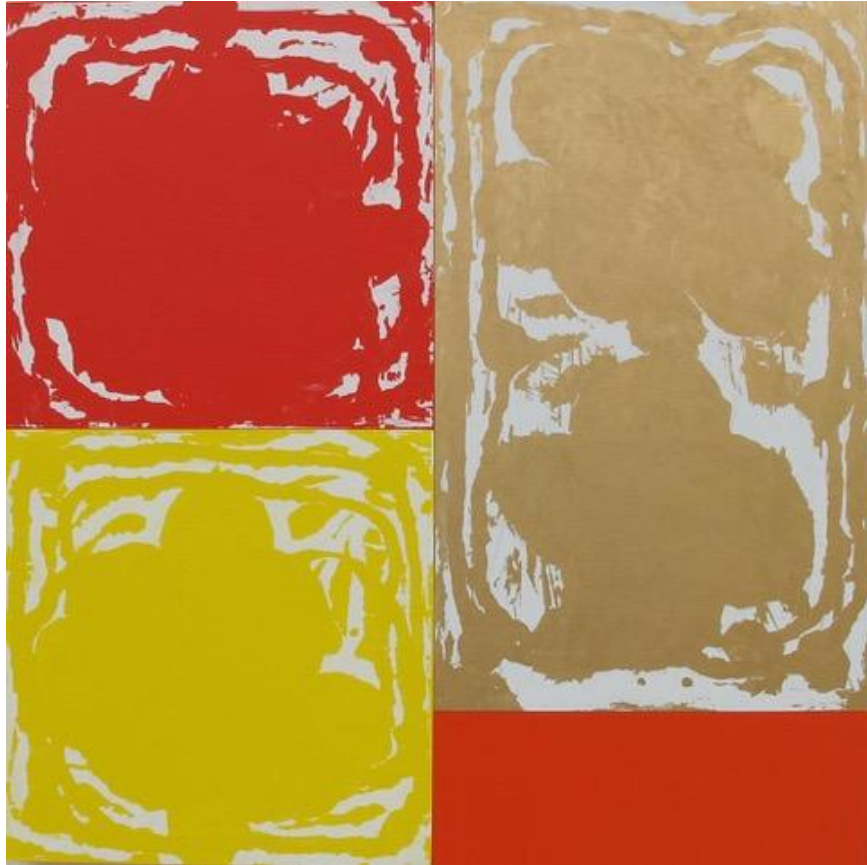
Jacques BOSSER, SoXo , 2015, technique mixte sur bois, 100 x 100 cm