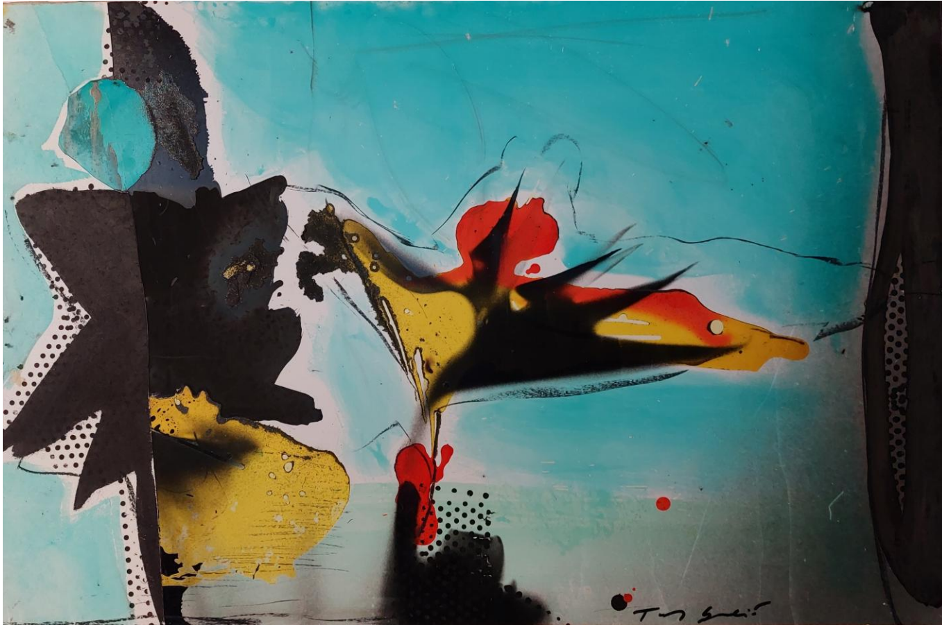
Tony SOULIE, Flowers , 2016, Technique mixte, 60 x 90 cm